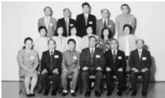
平成12年度 埼玉県立岩槻高等学校同窓会 定期総会 「岩槻市 WATSU」にて平成12年4月22日